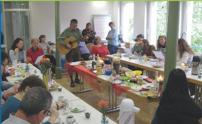
Wir tauschen auch sonst noch Nettes miteinander aus. Social Networking wird ebenso weiter ausgebaut.

Zählst du noch ... oder tauschst du schon?